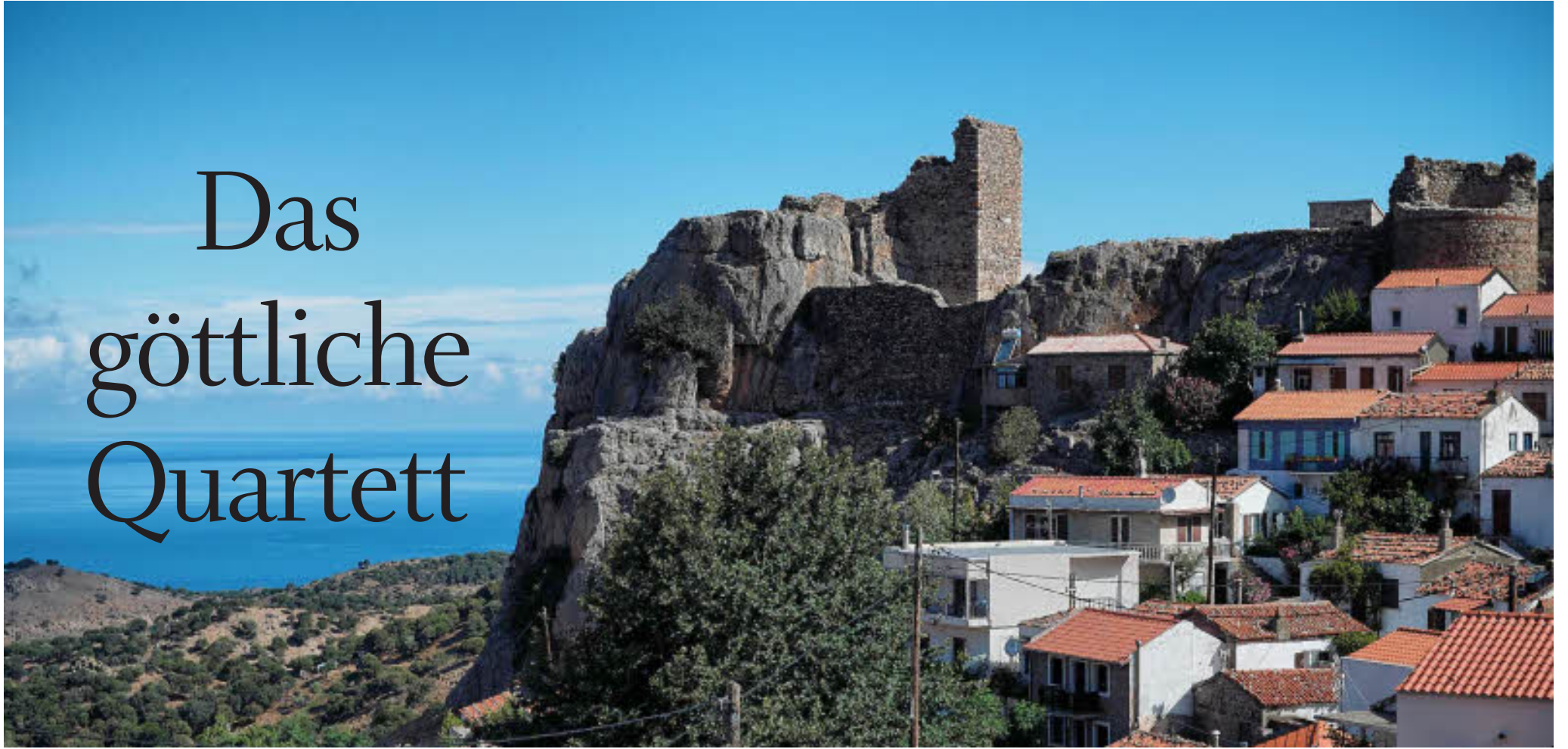
Strategischer Blick auf das Ägäische Meer von der Burgruine der Genueser Statthalter über dem Städtchen Chora.