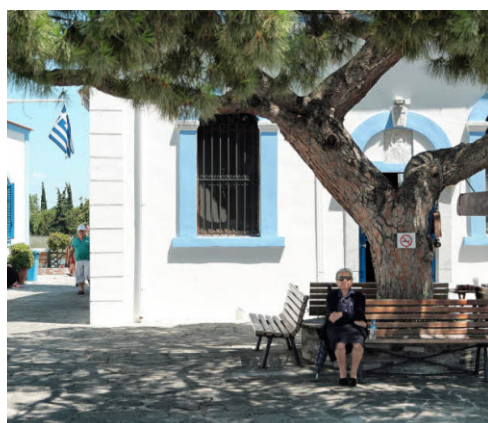
.Beschauliche Rast im Schatten.

Auskünfte zur Insel: Ostmakedonien und Thrakien Info, www.emtgreece.com Griechische Zentrale für Fremdenverkehr, www.visitgreece.com