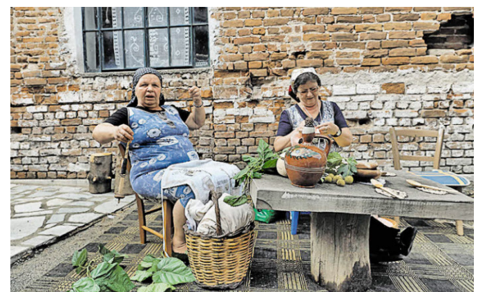
Vorbereitung zum Seidenraupen-Fest.